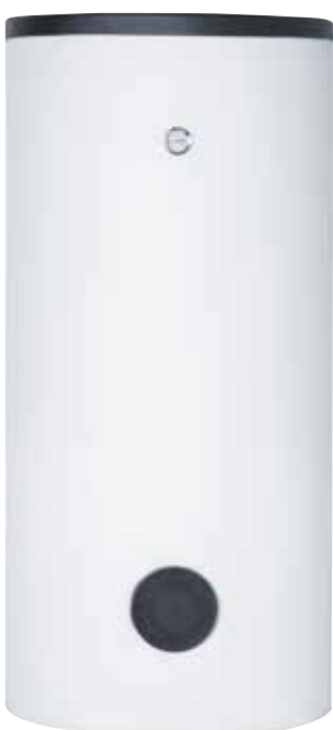
Vorderansicht ab 400 L