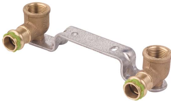
VC 4976 Montageeinheit gekröpft, 150mm